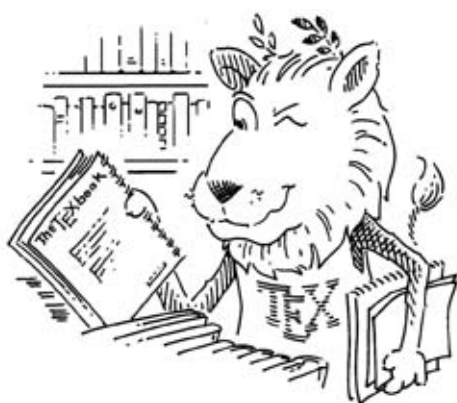
(a) O mascote estudando

Essa é uma subseção da subseção 2.1 do capítulo 2. Subseções como esta não deverão ser numeradas.