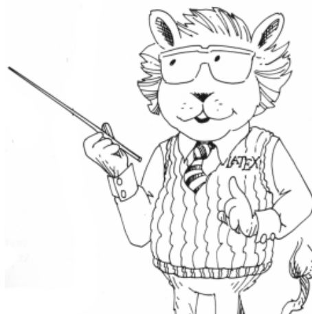
(b) O mascote ensinando