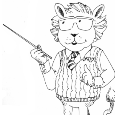
(b) O mascote ensinando